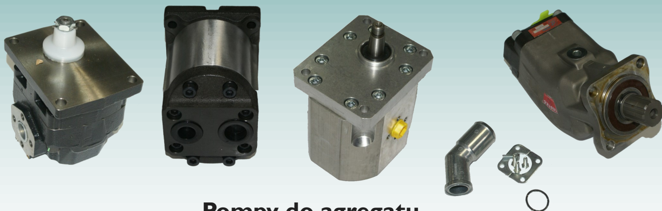
Pompy do agregatu