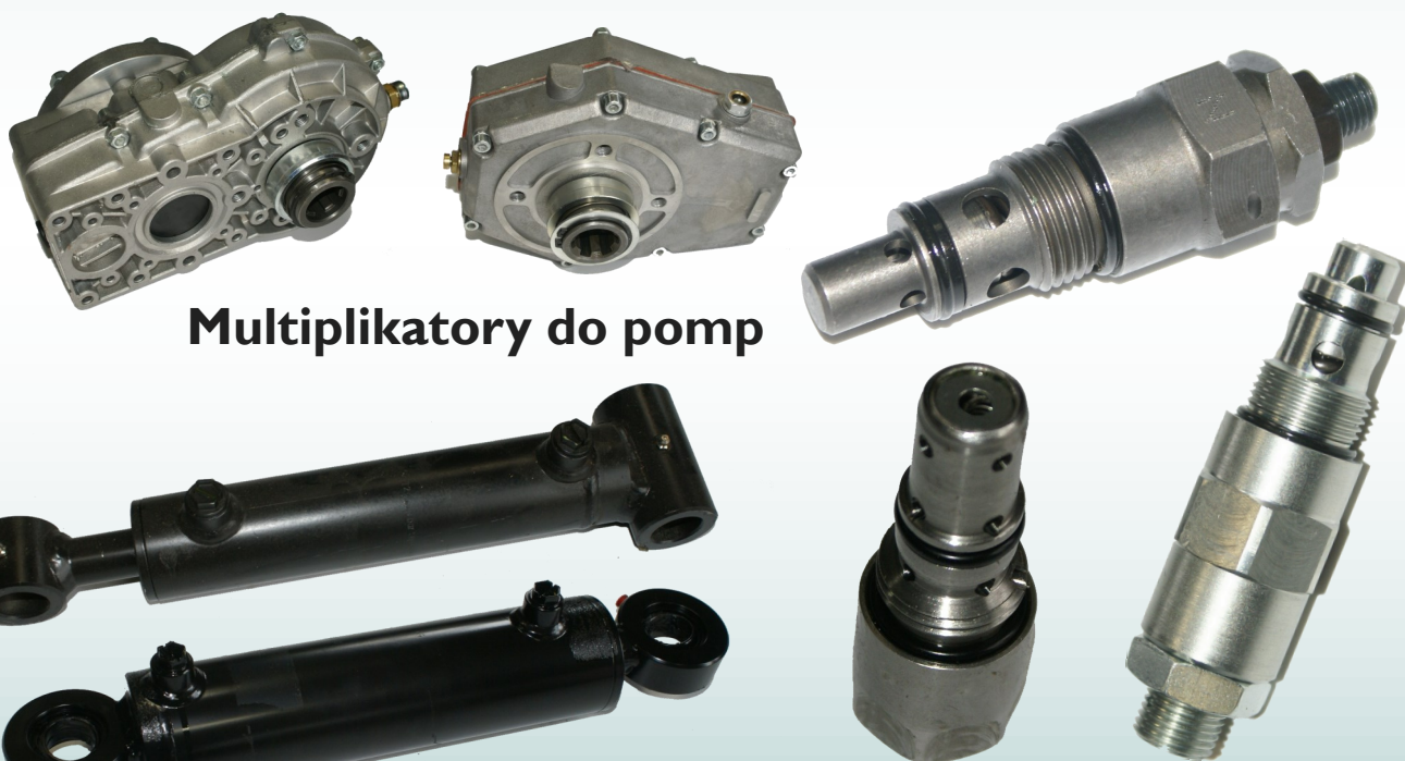
Multiplikatory do pomp