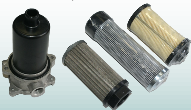
Filtry i wkłady